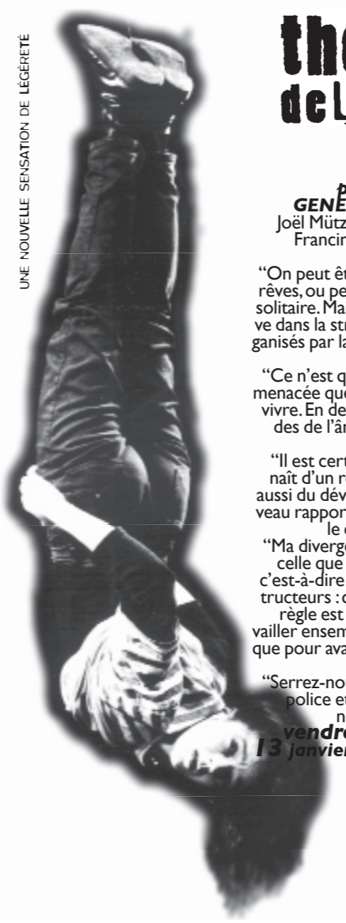
UNE NOUVELLE SENSATION DE LÉGÈRETÉ