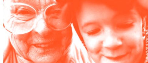
PHOTOGRAPHIE DE SPOUTNIK