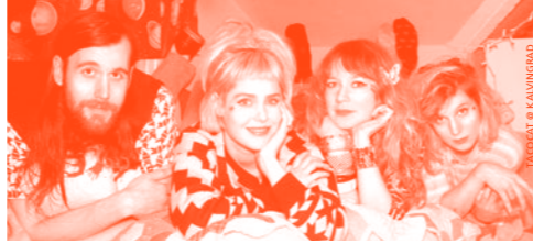
PHOTOGRAPHIE DE KALVINGRAD

♦ KALVINGRAD | 20H30 | 16CHF, 14CHF EN PRELOC TACOCAT | surf garage punk pop | USA DUCK DUCK GREY DUCK | soul surf garage | CH CAPITAL YOUTH | pop-punk | CH