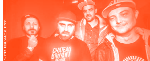
CHATEAU BRUYANT & LE ZOO

♦ LE ZOO | 23H | 20CHF SUR PLACE, 18CHF EN PRÉLOC / +18 Préloc sur Petzitickets.ch, Inside Tattoo, Urgence Disk et Central Station CHATEAU BRUYANT 5 ans, + special guest GREMS! [BASS MUSIC / HIP HOP] GREMS | Musicast | FR NIVEAU ZERO | Chateau Bruyant | FR TAMBOUR BATTANT | Chateau Bruyant | FR THE UNIK | Chateau Bruyant, Buygore Records | FR