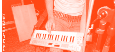
SYNDROME WPW & URGENCE DISK

♦ URGENCE DISK | 18H30 | PRIX LIBRE SYNDROME WPW | Electro noise | CH